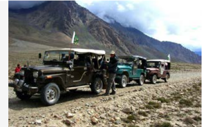
JEEPS 4X4 TOYOTA