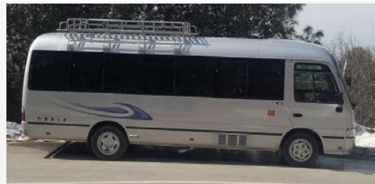
TOYOTA SALOON COASTER (7-16PAX)