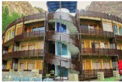
Famree Resort Attaabad Lake