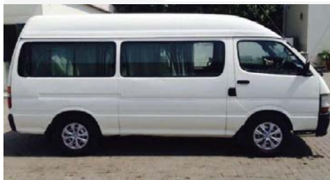
TOYOTA HI ROOF (2-7PAX)