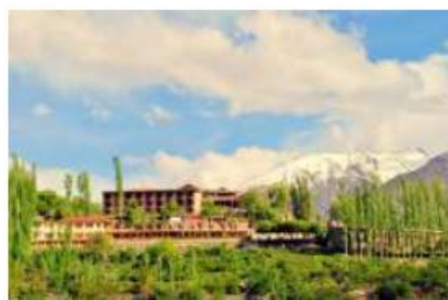
Darbar hotel Karimabad