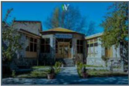
Eagles Nest Duiker