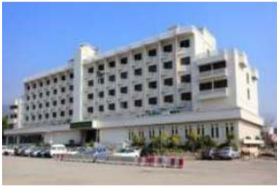
Hill View hotel Islamabad