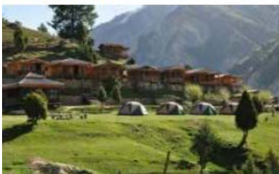
Raikot Sari Fairy Meadows