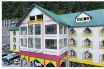
Notheren Retreat Naran